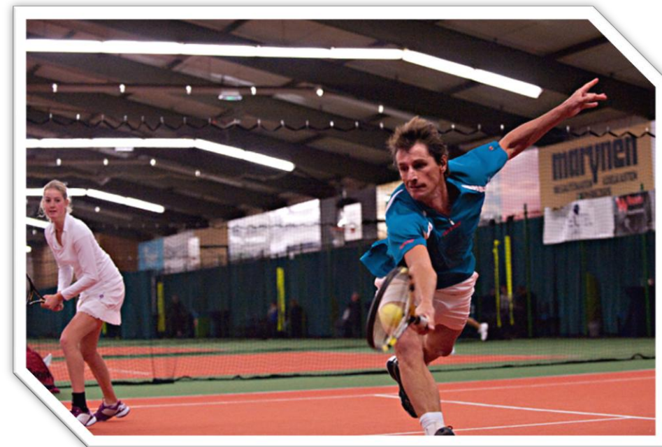
Paul Haarhuis in actie tijdens zijn demonstratiewedstrijd in Goes.

Toch waren het Haarhuis en Van der Sar die de set uiteindelijk naar zich toe trokken. De grote winnaar in Goes was echter het publiek.