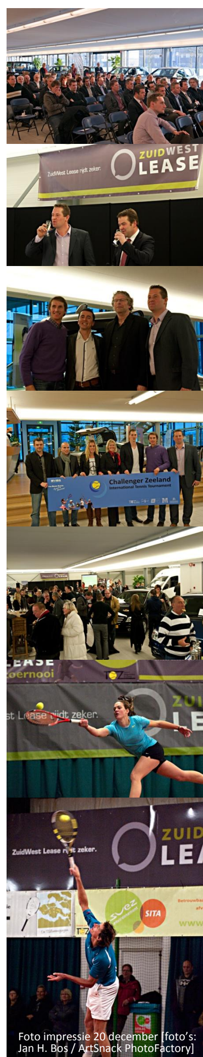
Foto impressie 20 december

[Eindverslag Thermphos International Tennis Tournament 2010]